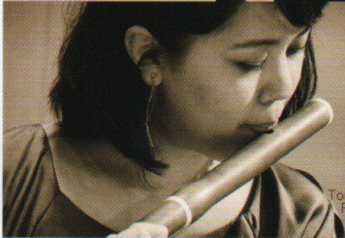
仲間知子 Tomoko NAKAMA Flûte traversière